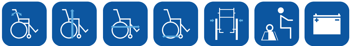
Rückenlehnenwinkel ▼ Gesamthöhe ▼ Gesamtlänge inkl. Beinstützen ▼ Gesamtlänge ohne Beinstützen ▼ Gesamtbreite ▼ Max. Nutzergewicht ▼ Batteriekapazität ▼