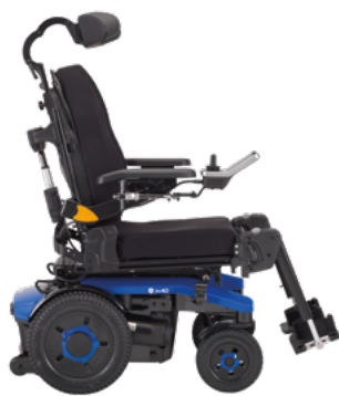
AVIVA RX 40 Modulte

Die Einstiegsvariante bietet eine hervorragende Mobilität im Innenraum und ist ideal für Nutzer mit einem weniger komplexen Versorgungsbedarf. Sie verfügt über eine einteilige Sitzplatte und ist optional mit teleskopierbarem Sitzrahmen erhältlich.