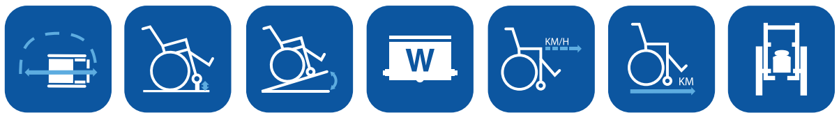
Wendekreis-durchmesser ▼ Max. überwindbare Höhe ▼ Max. sichere Neigung ▼ Motorleistung ▼ Geschwindigkeit ▼ Reichweite ▼ Gesamtgewicht ▼