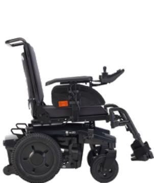
AVIVA RX 20 Modulte

Der richtige AVIVA für jeden Nutzer! Die AVIVA Elektro-Rollstühle lassen sich individuell ausstatten. Hier einige Beispiele: