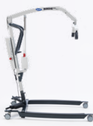
Birdie EVO Elektrisch

▲ Die Standard-Variante des Invacare Birdie EVO mit manueller Spreizung