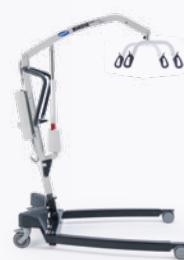
Birdie EVO PLUS

▲ Die Variante des Invacare Birdie EVO mit elektrischer Spreizung