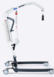
Birdie EVO COMPACT

Die mobile Patientenlifter-Serie. (R)evolutionär weiterentwickelt.