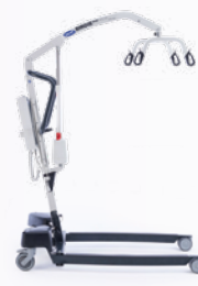
Birdie EVO XPLUS

▲ Maximale Ausstattung für höchste Ansprüche in der institutionellen Pflege