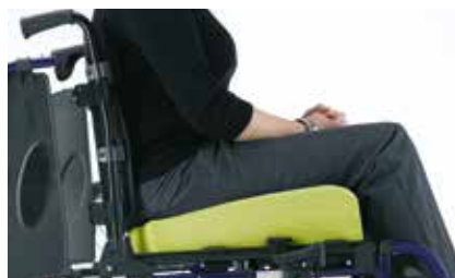
Matrx Flo-tech Contour Lo-Back