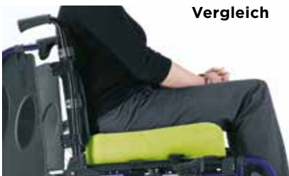
Matrx Flo-tech Contour