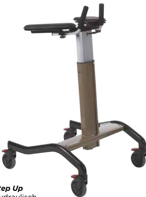
Step Up Hydraulisch