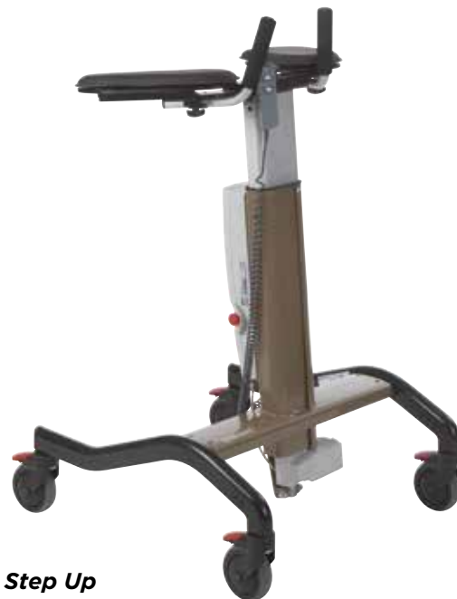
Step Up Elektrisch