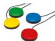
1685 / 1686 / 1687 / 1690